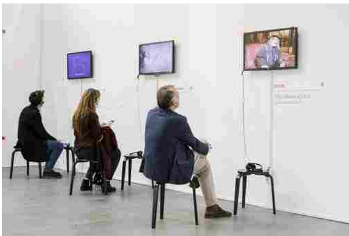
Artissima, parte la terza edizione di Torino Social Impact Art Award

Residenza per due giovani artisti con background multiculturale